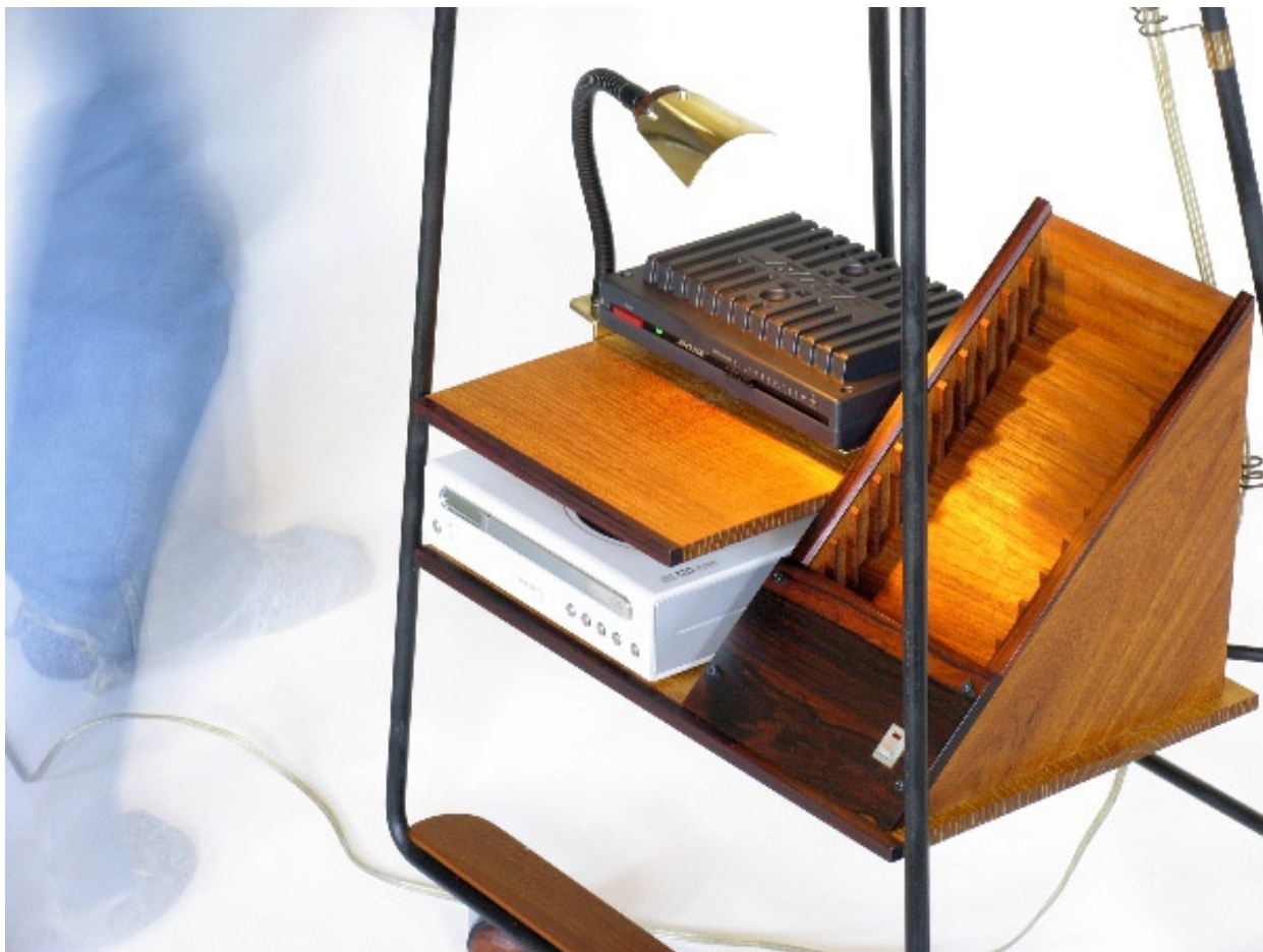
ミュージックキャビネット機器交換_2004年